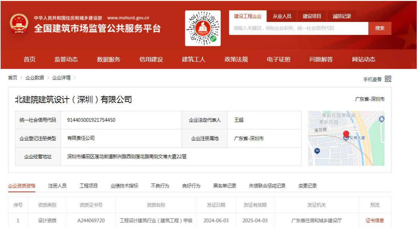
企业资质在全国建筑市场监管公共服务平台查询截图