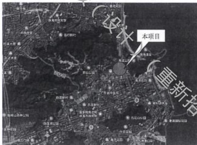
项目用地区位示意图

项目位于珠海核心商圈之一的吉大商圈，东侧为海滨南路，西侧为景山路，南侧为吉大路。