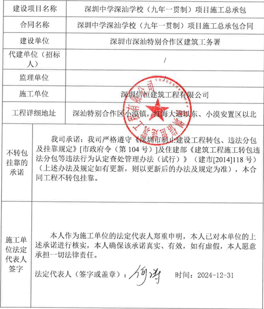
附件 6 深圳市深汕特别合作区房屋建筑和市政工程不转包挂靠承诺书、施工投 标承诺函