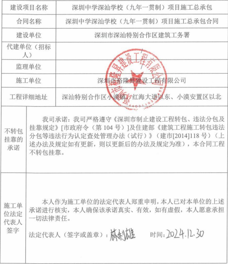
附件 6 深圳市深汕特别合作区房屋建筑和市政工程不转包挂靠承诺书、施工投 标承诺函