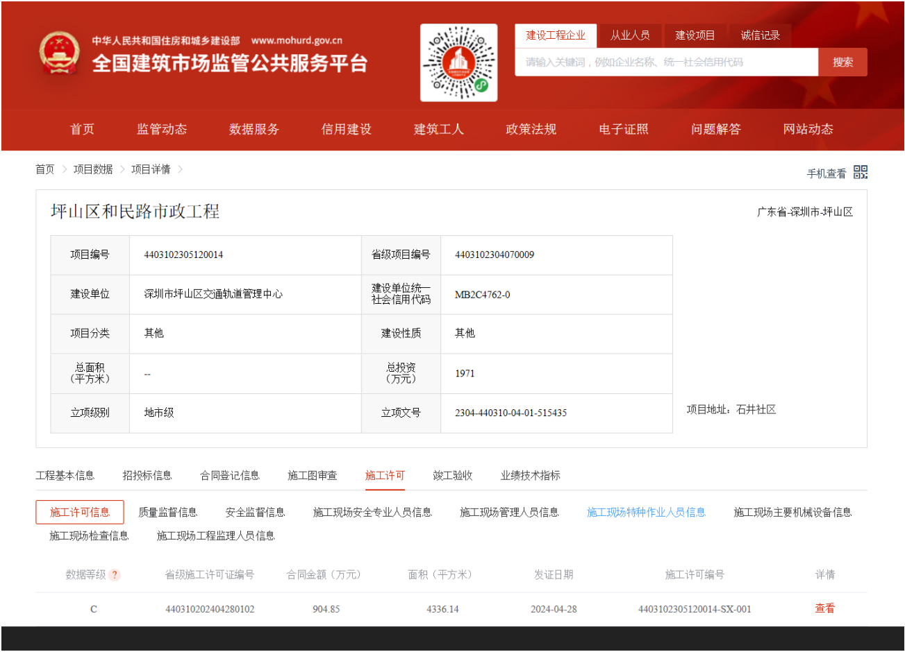
“全国建筑市场监管公共服务平台”查询结果截图