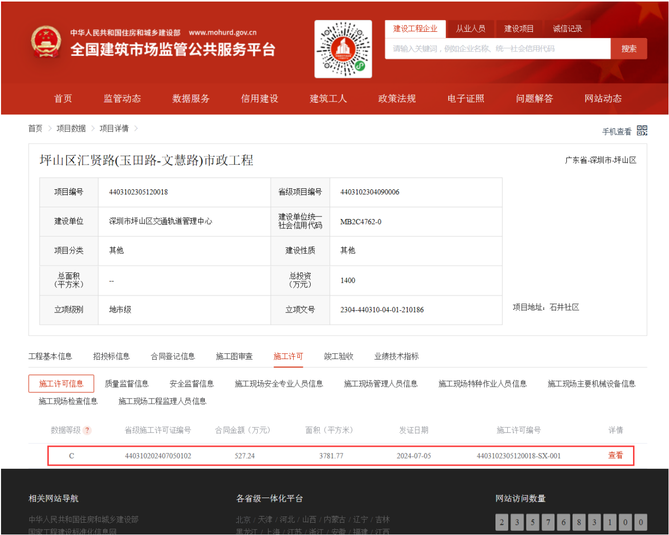
“全国建筑市场监管公共服务平台”查询结果截图