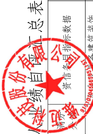
投标人业绩自评价汇总表