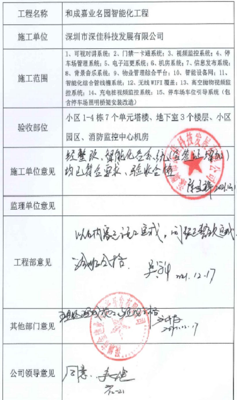
甲指分包工程竣工验收表