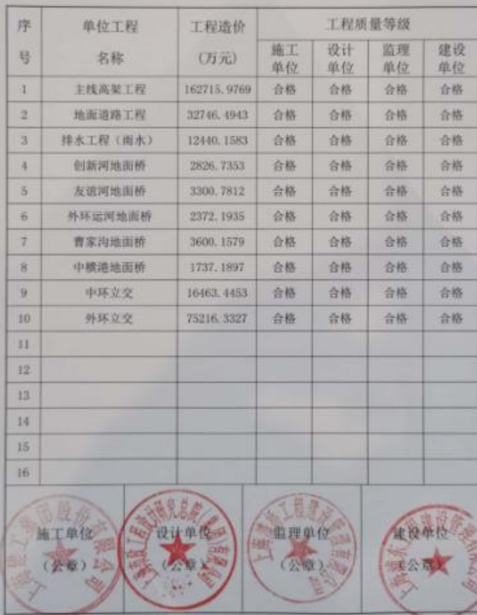
单位工程质量等级评定汇总表