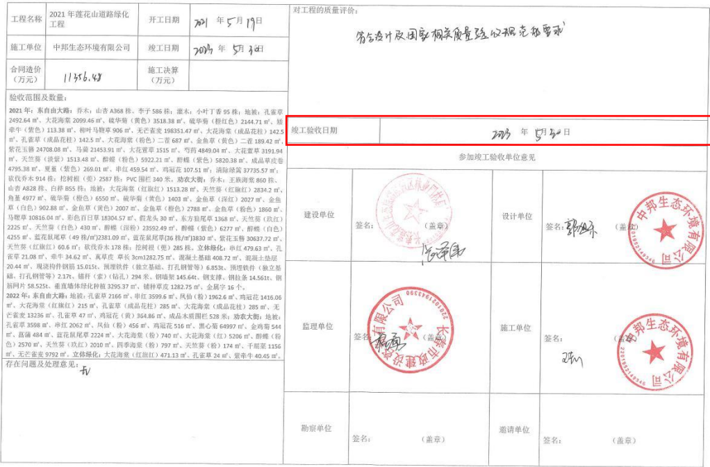
表 D.4.6 竣 工 验 收 证 书