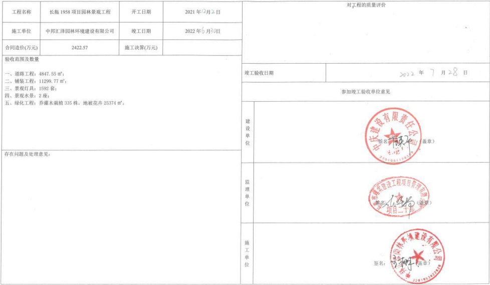
表 D.4.6 竣工验收证书