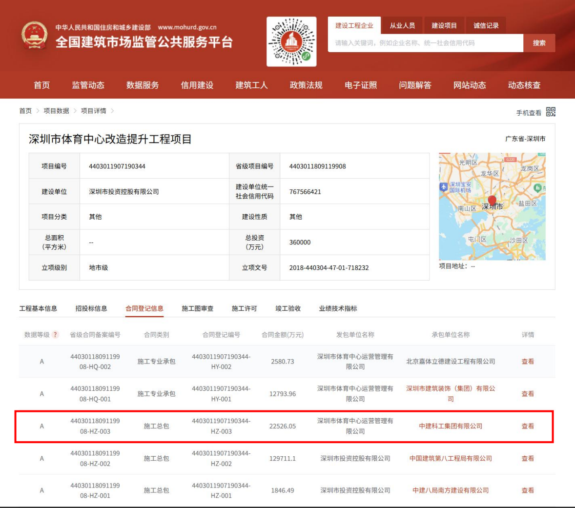
深圳市体育中心改造提升工程项目体育馆幕墙(含金属屋面)工程全国建筑市场监管公共服务平台截图 https://jzsc.mohurd.gov.cn/data/project/detail?id=1940207