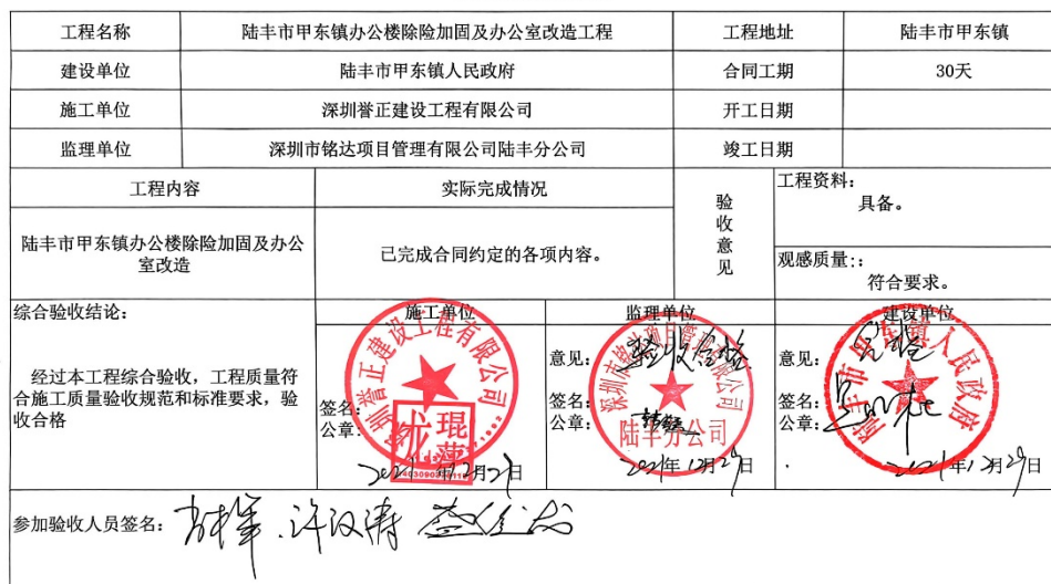
单位工程竣工验收表