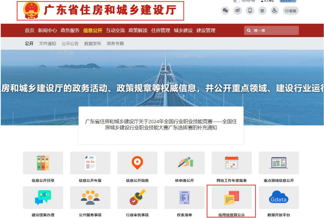
广东省住建厅平台查询截图