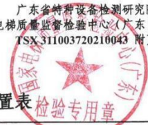
乘客和载货电梯适用参数范围和配置表