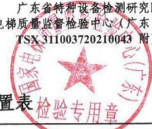
乘客和载货电梯适用参数范围和配置表