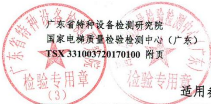
适用参数范围和配置表