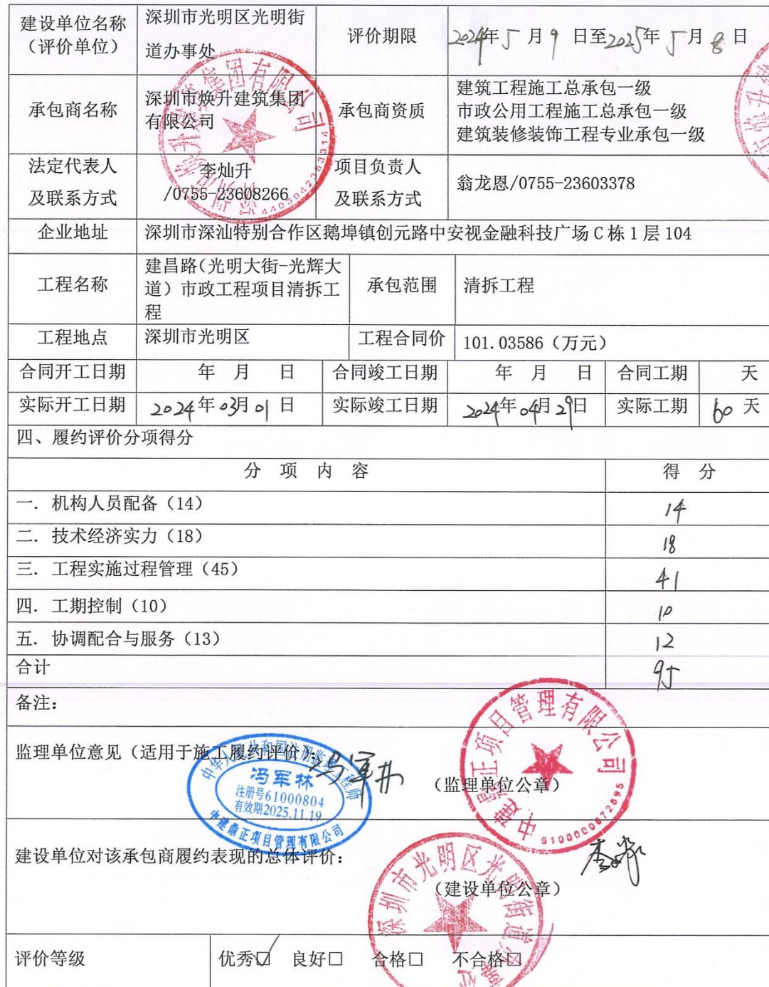
深圳市建设工程承包商履约评价报告书