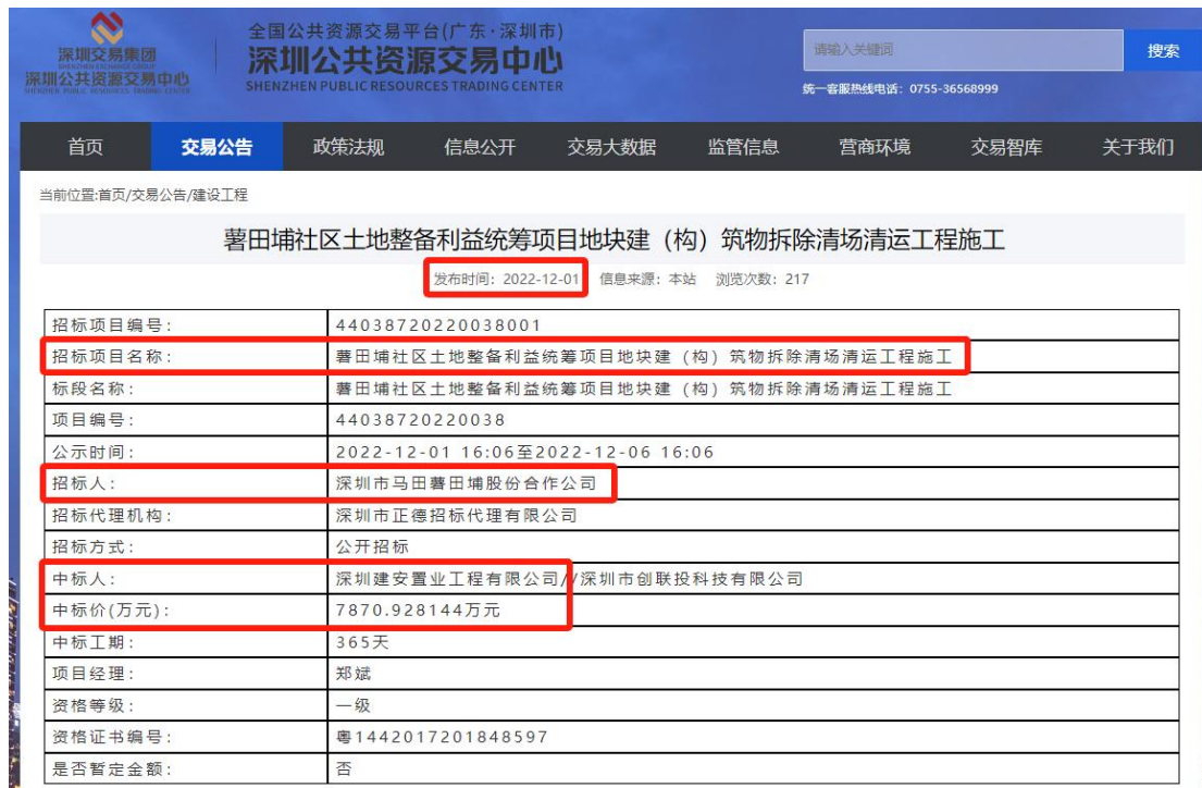
深圳公共资源交易中心网站“招投标”相关查询结果截图

链接: https://www.szggzy.com/jygg/details.html?contentId=1732992&channelId=2851