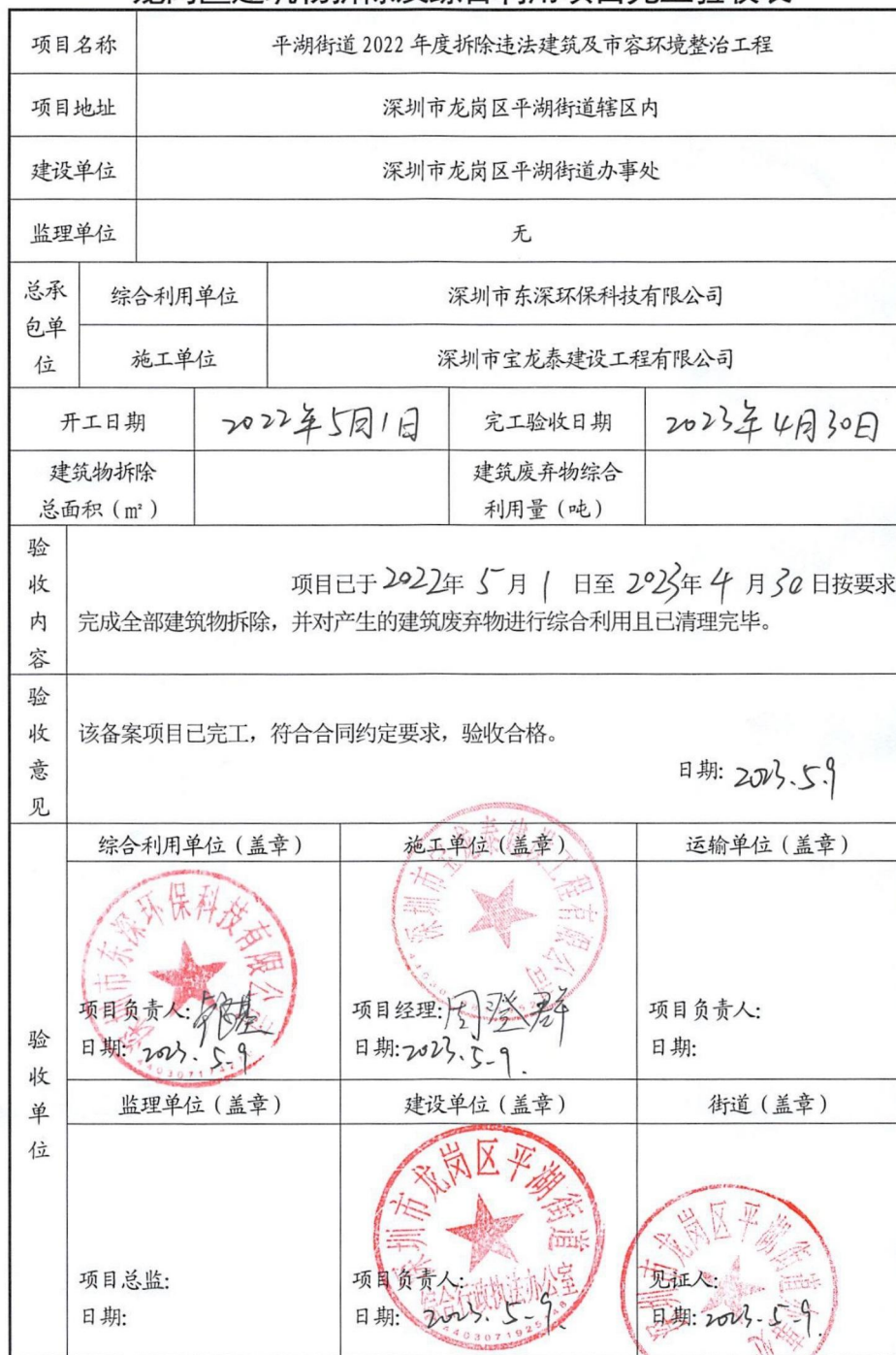
龙岗区建筑物拆除及综合利用项目完工验收表