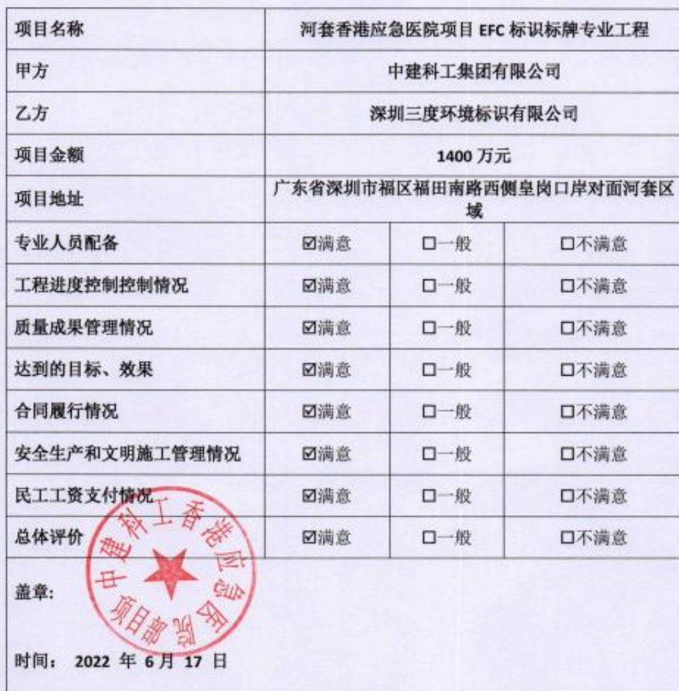
工程项目施工履约情况评价表