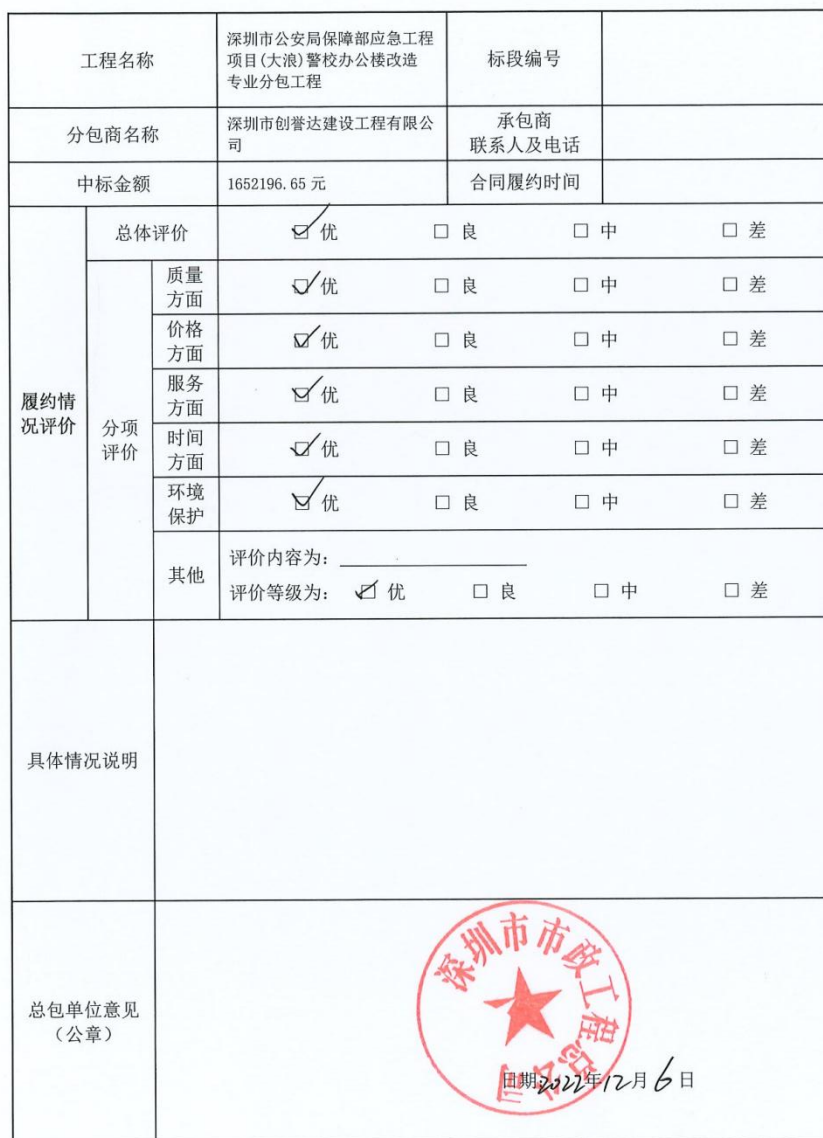
承包商履约情况反馈表