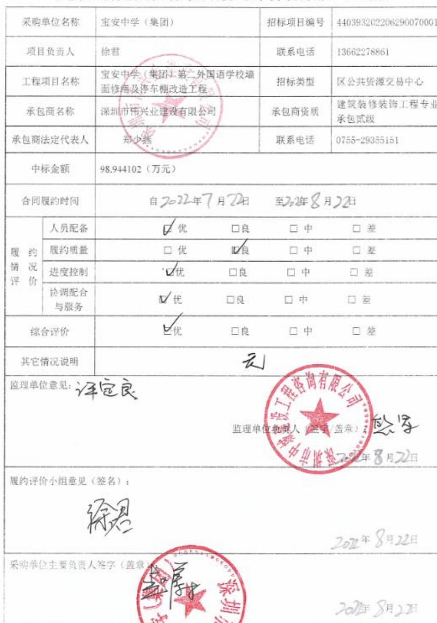
学校、幼儿园招标项目履约评价备案表（工程）