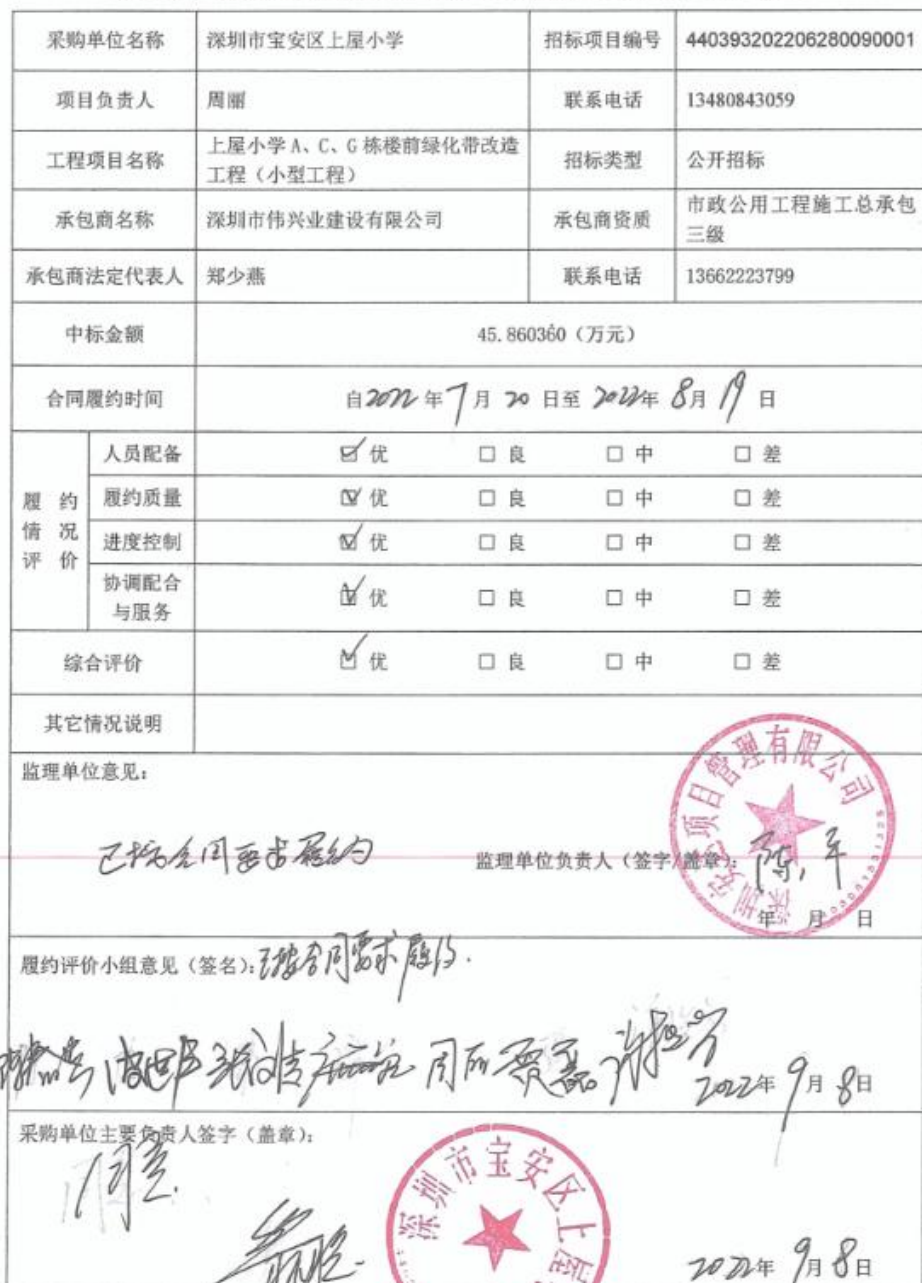
学校、幼儿园招标项目履约评价备案表（工程）