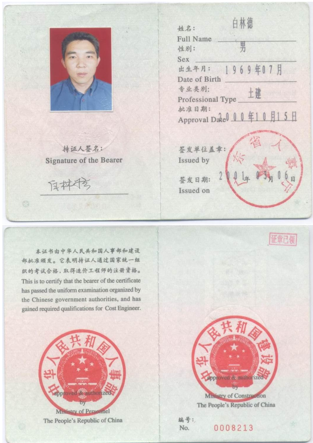
白林德 造价工程师执业资格证