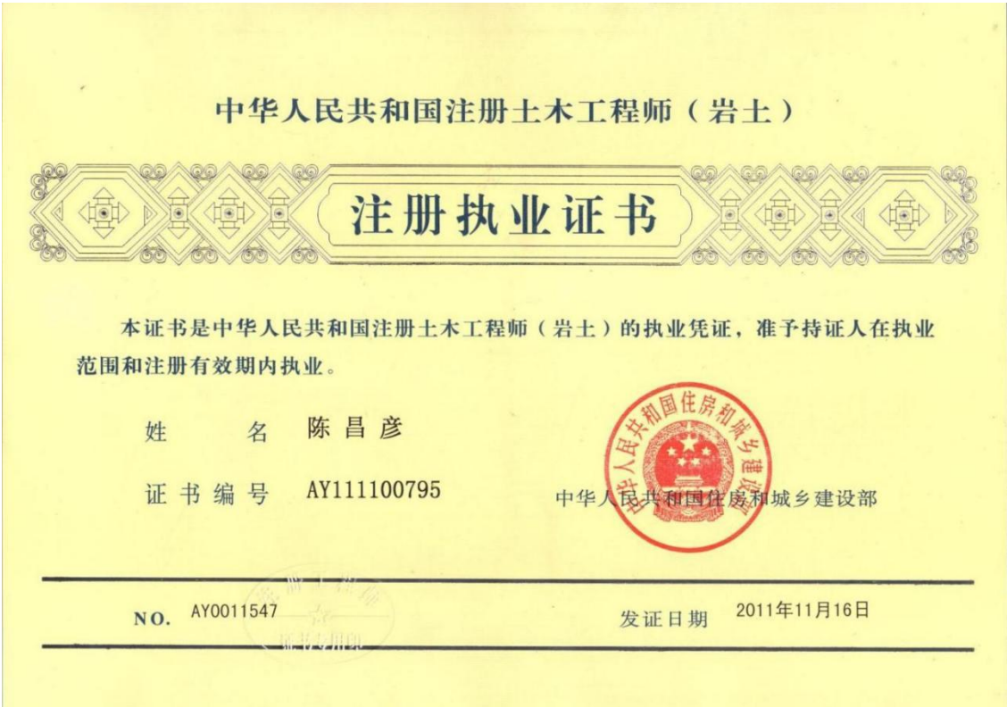
全国建筑市场监管公共服务平台（四库一平台）注册信息和证书有效期截图