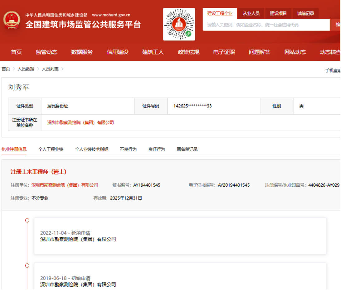
全国建筑市场监管公共服务平台网页截图