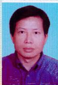
发证机构钢印 Invalid Without Stamping

This certificate can be regarded as a standard for enterprises and institutions to be selected on employment and position.