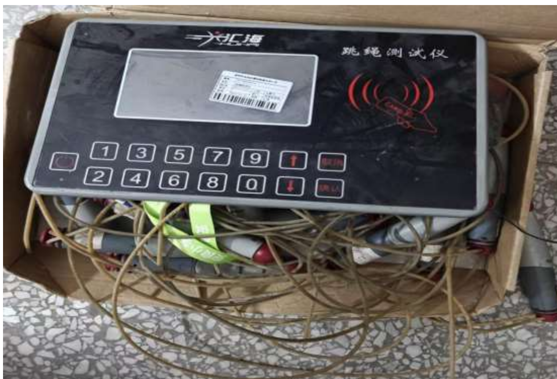
9. 无线接收器 1 台 资产编码：371900000018