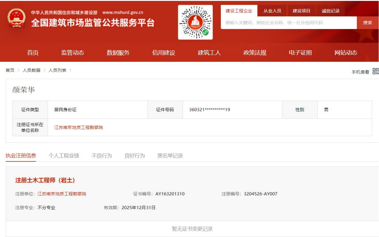
(4) 注册执业证网站截图