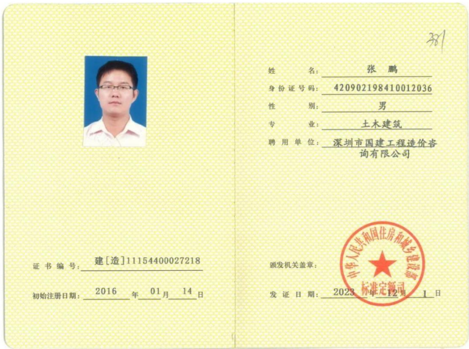
一级注册造价工程师证