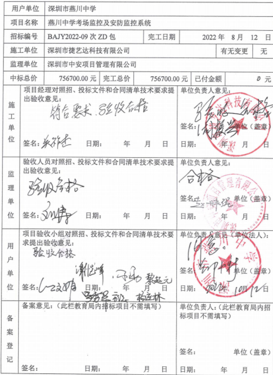
宝安区教育系统设备类项目终验报告（表五）

注： 1. 本表一式四份，用户单位、施工单位、监理单位、宝安区教育信息中心各存一份。 2. 用户单位意见栏需负责该项目的验收小组各成员签名。