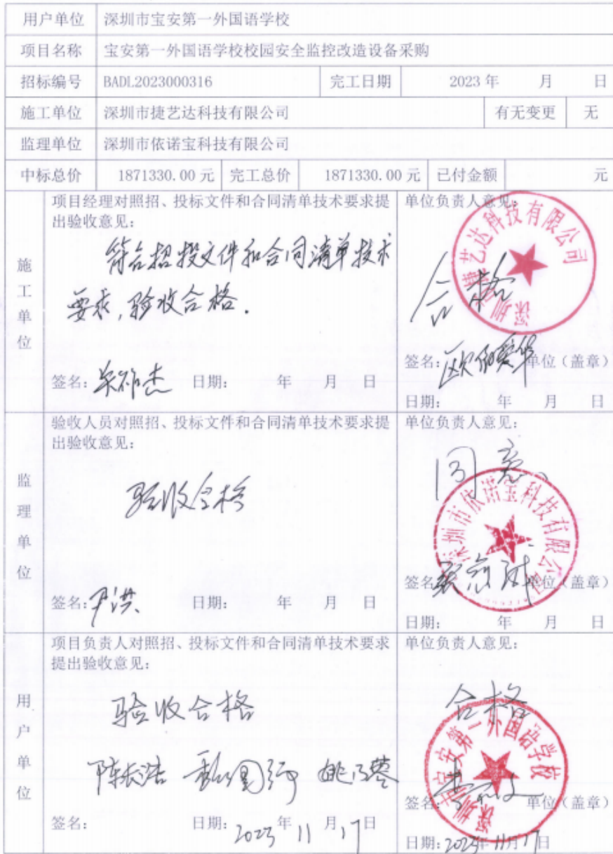
宝安区教育系统设备类项目终验报告（表五）