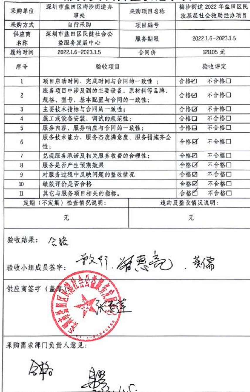
服务类项目验收记录表