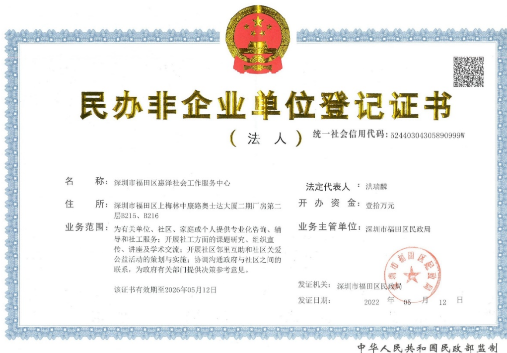
民办非企业单位登记证书（正本）扫描件

我机构——深圳市福田区惠泽社会工作服务中心是在中华人民共和国境内注册的具有独立法人资格、具有独立承担民事责任能力的民办非企业单位，以下为我机构民办非企业单位登记证书（法人）扫描件：