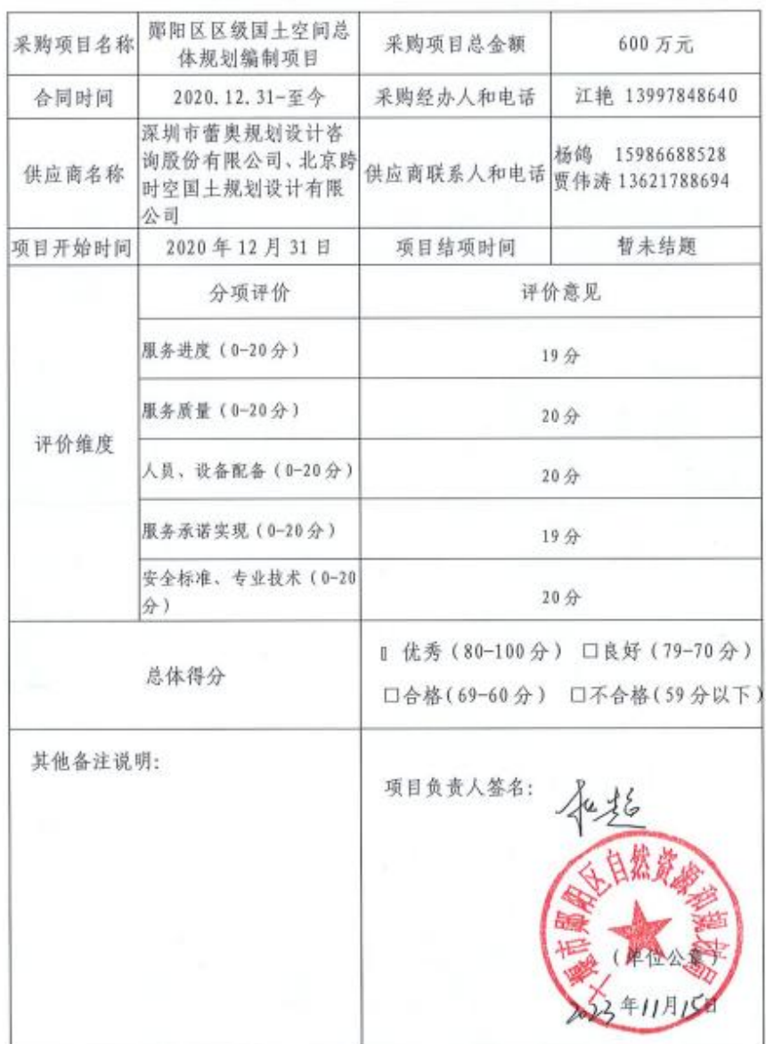
十堰市鄞阳区自然资源和规划局服务类采购供应商履约评价报告