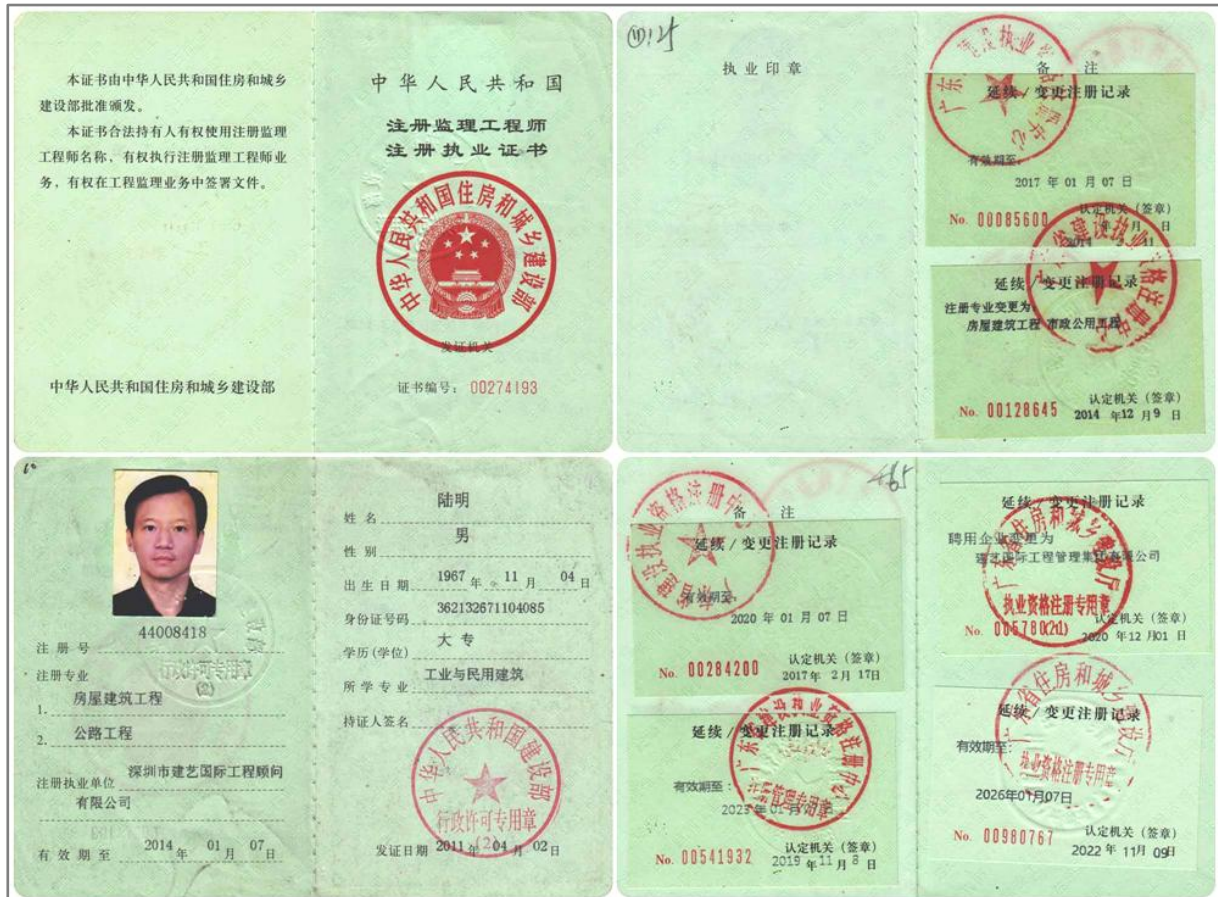
国家监理工程师注册证书