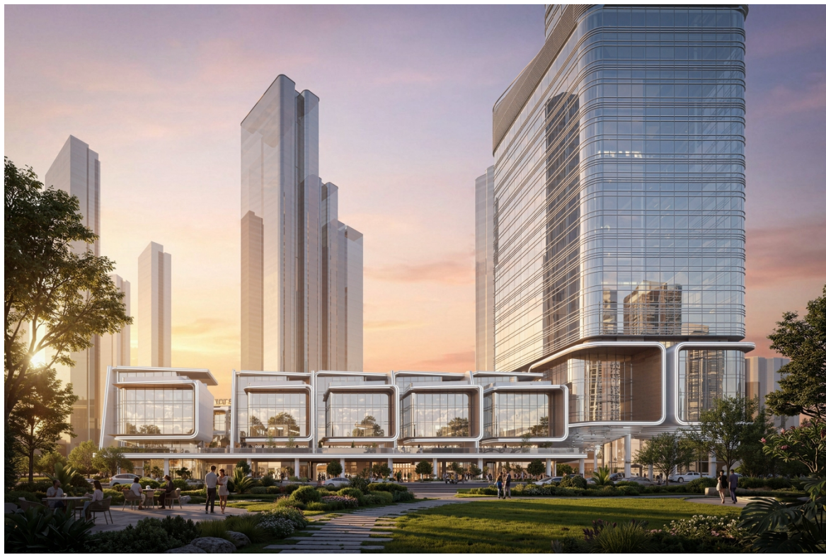
中标候选方案 3：华东建筑设计研究院有限公司//FIOworks Limited