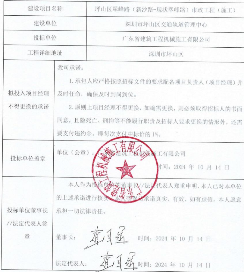
拟投入项目经理不得更换承诺书