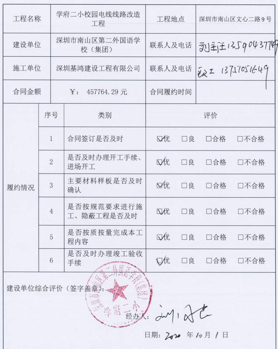
工程项目履约评价表

综合评价说明：一项不合格最高评价为合格，两项或以上不合格的评定为不合格；半数以上优的方可评价为优。