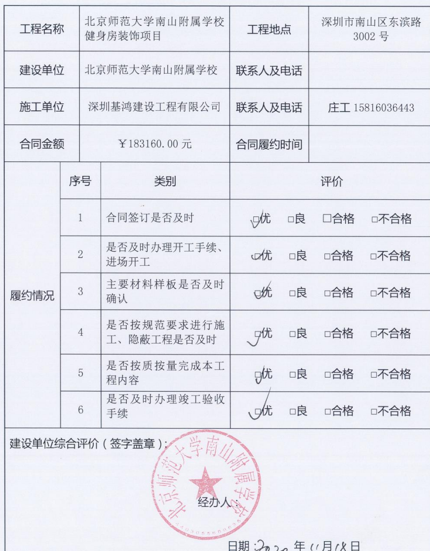
工程项目履约评价表

综合评价说明：一项不合格最高评价为合格，两项或以上不合格的评定为不合格；半数以上