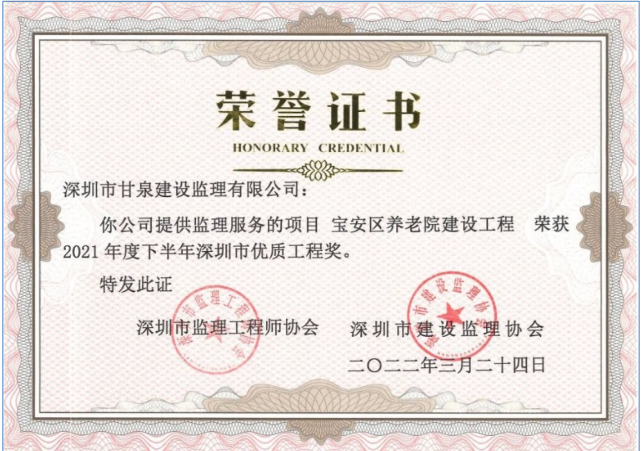
宝安区养老院建设工程获深圳市优质工程奖