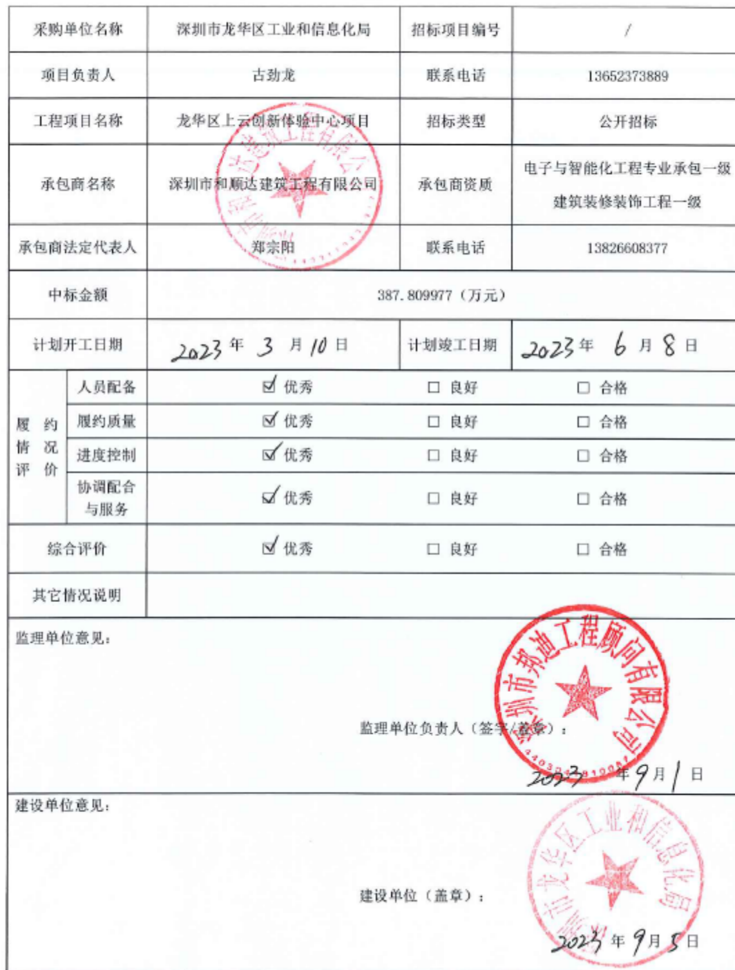
项目履约评价表（工程）