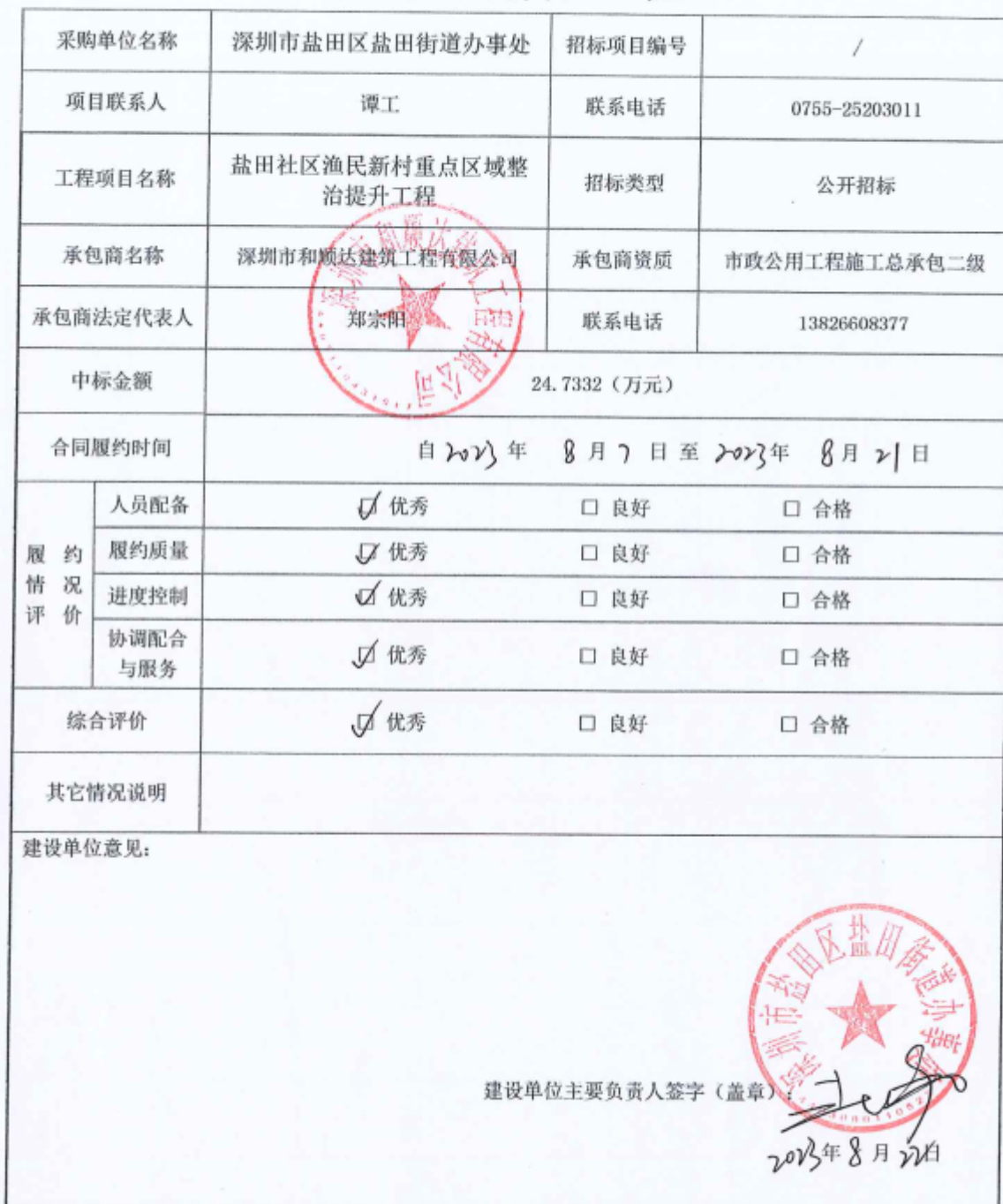
项目履约评价表（工程）