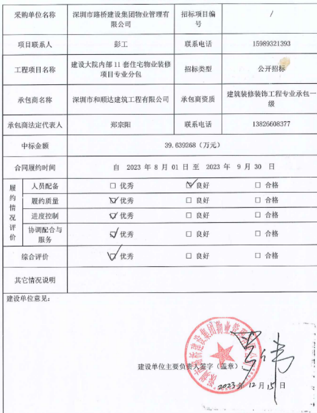
项目履约评价表（工程）