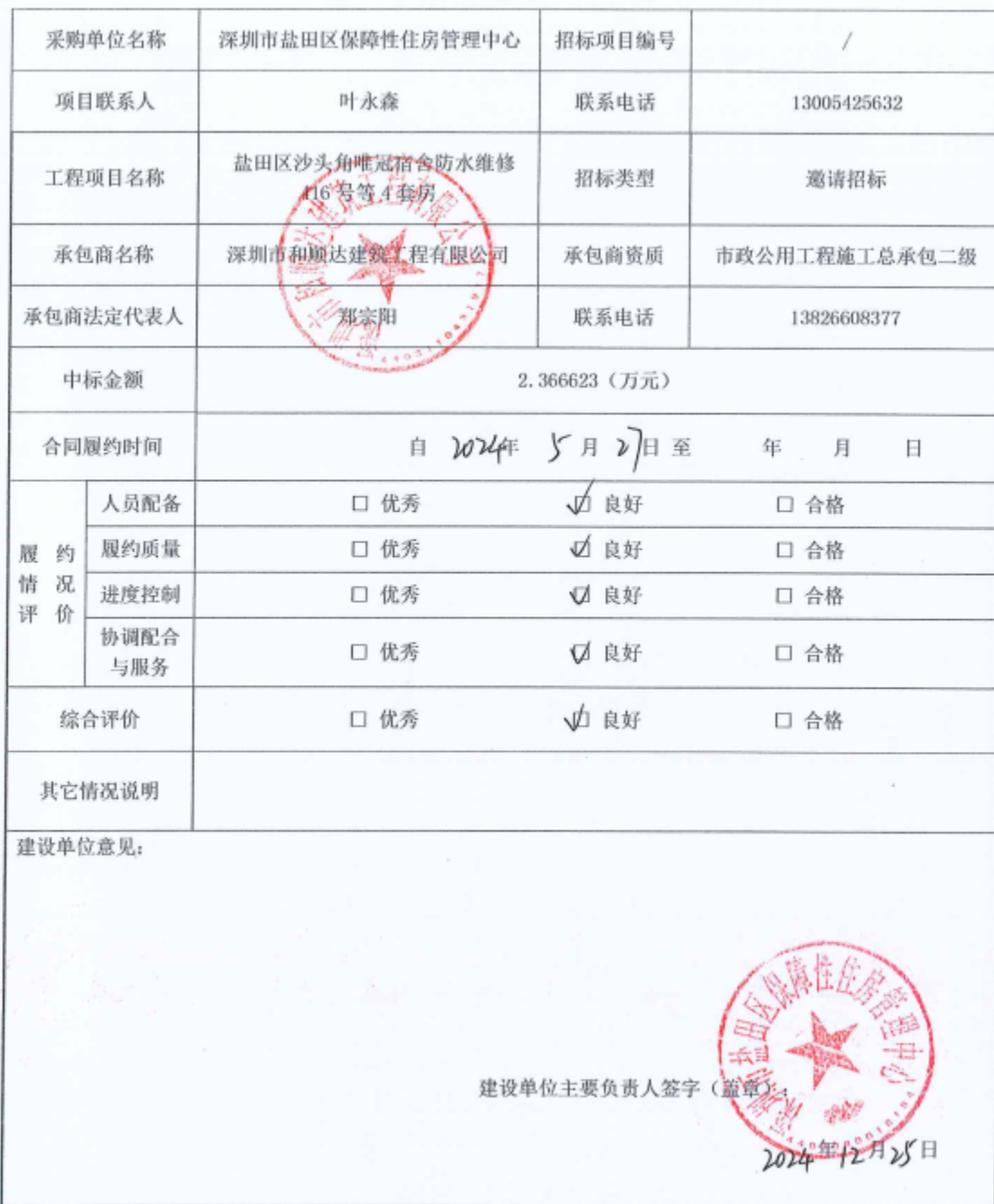
项目履约评价表（工程）