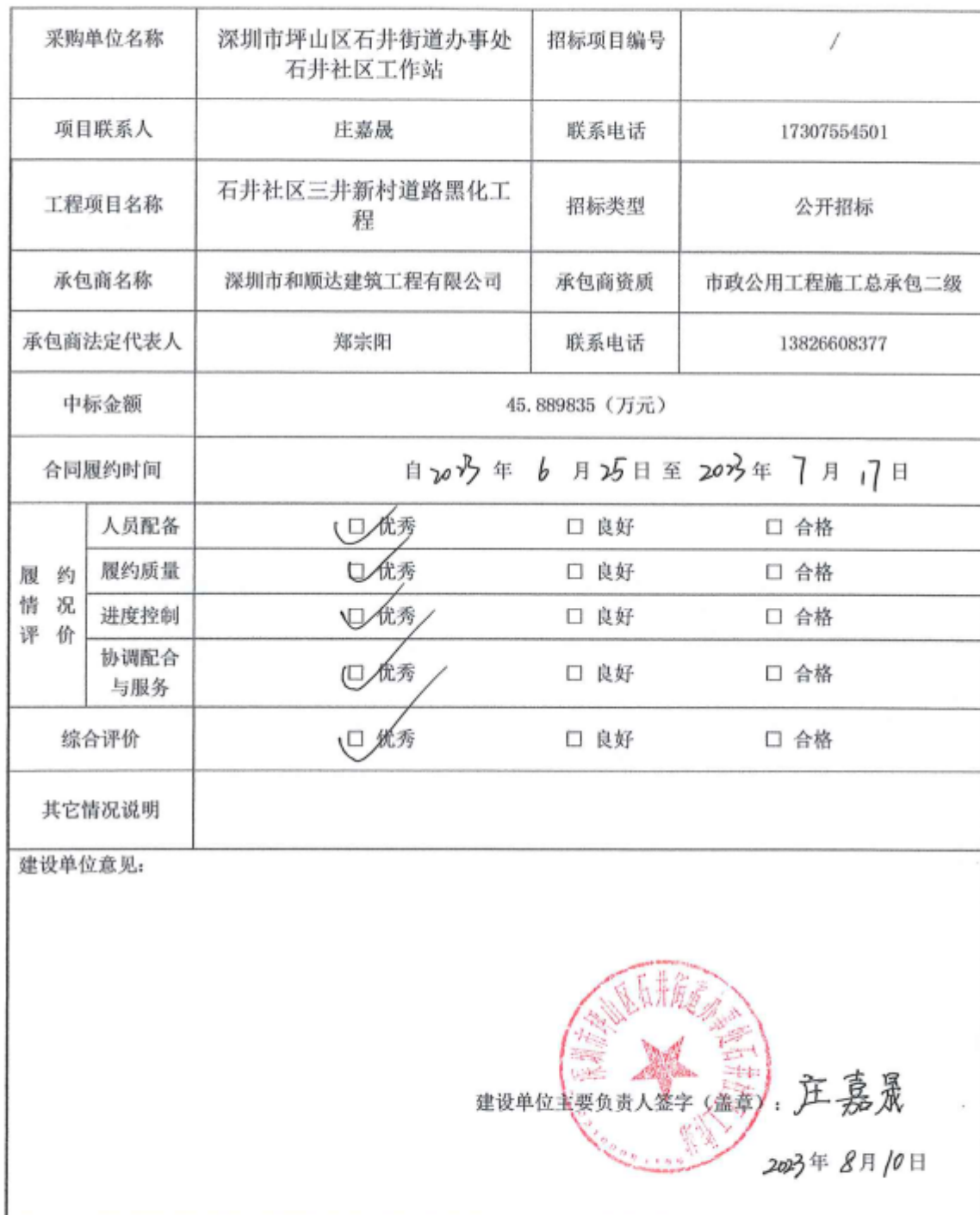
项目履约评价表（工程）