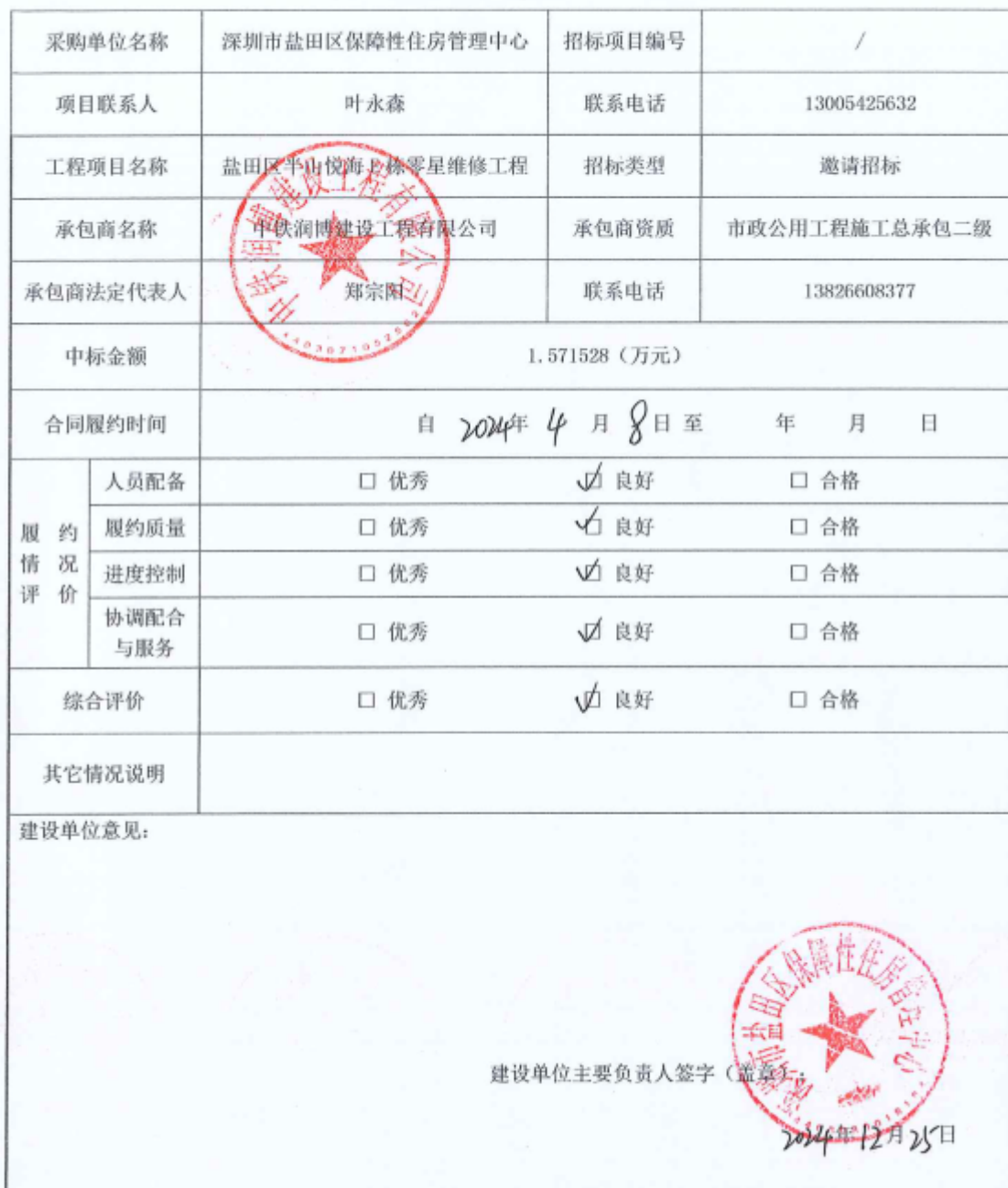
项目履约评价表（工程）