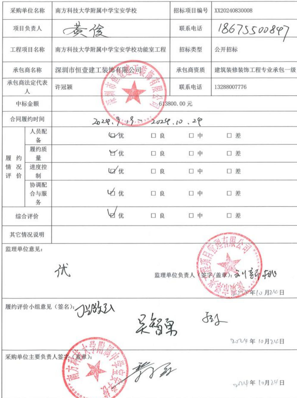
学校、幼儿园招标项目履约评价备案表(工程)