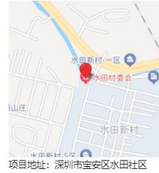
项目地址: 深圳市宝安区水田社区

工程基本信息 招标投标信息 合同登记信息 施工图审查 施工许可 竣工验收 业绩技术指标