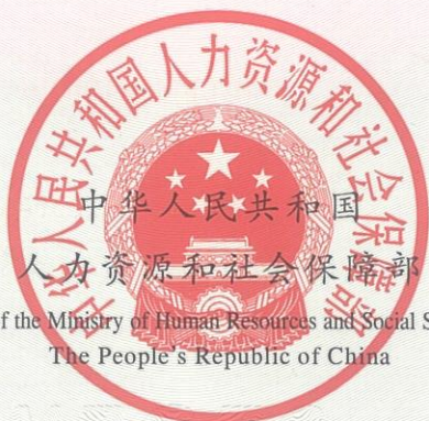
Seal of the Ministry of Human Resources and Social Security, The People's Republic of China

According to the Labour Law of the People's Republic of China and the national occupational skill standards, the certificate is herewith issued after passing testing and assessment.