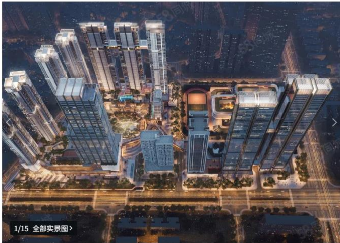
1/15 全部实景图 >