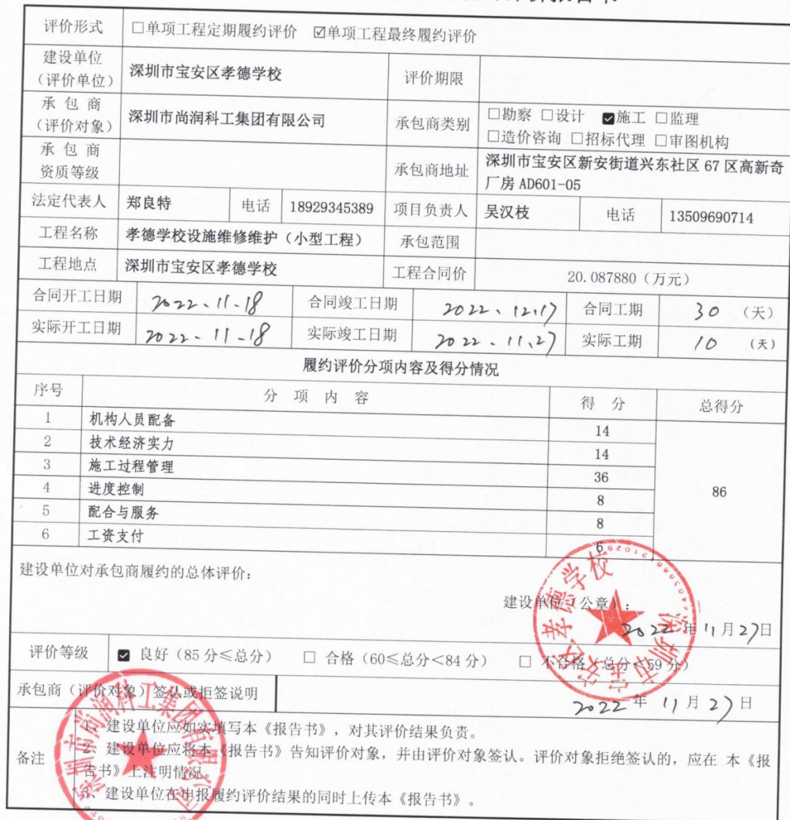
建设工程承包商单项工程履约评价报告书