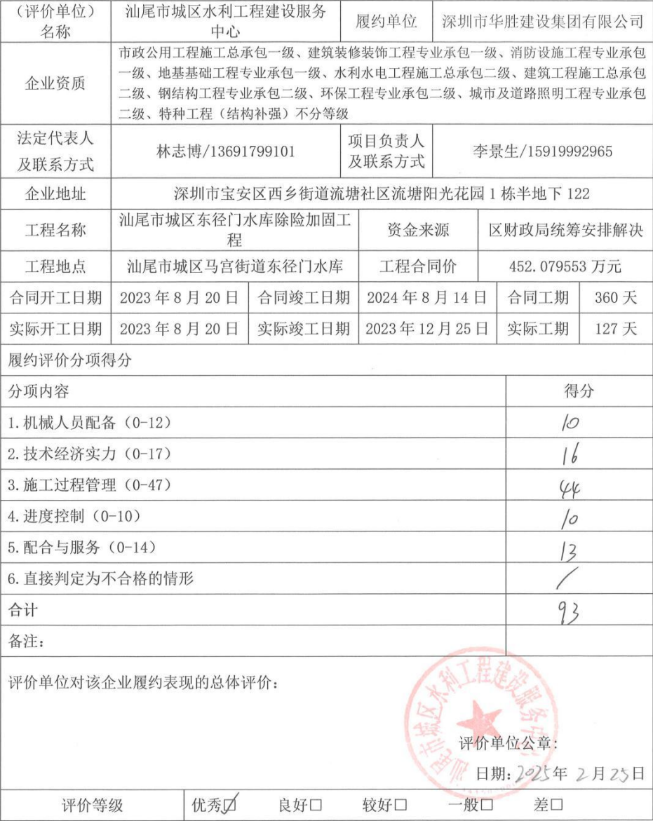
履约评价情况反馈表

说明：履约情况分为：优秀、良好、较好、一般、差，请首先在对应的类别前打“√”，然后在“具体情况”一栏详细说明情况。