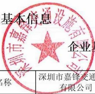
企业基础信息情况表