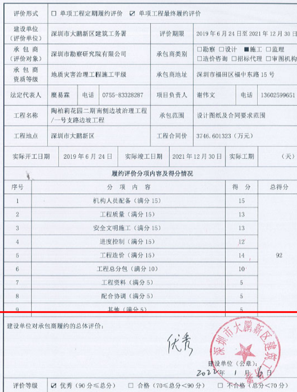
建设工程承包商单项工程履约评价表