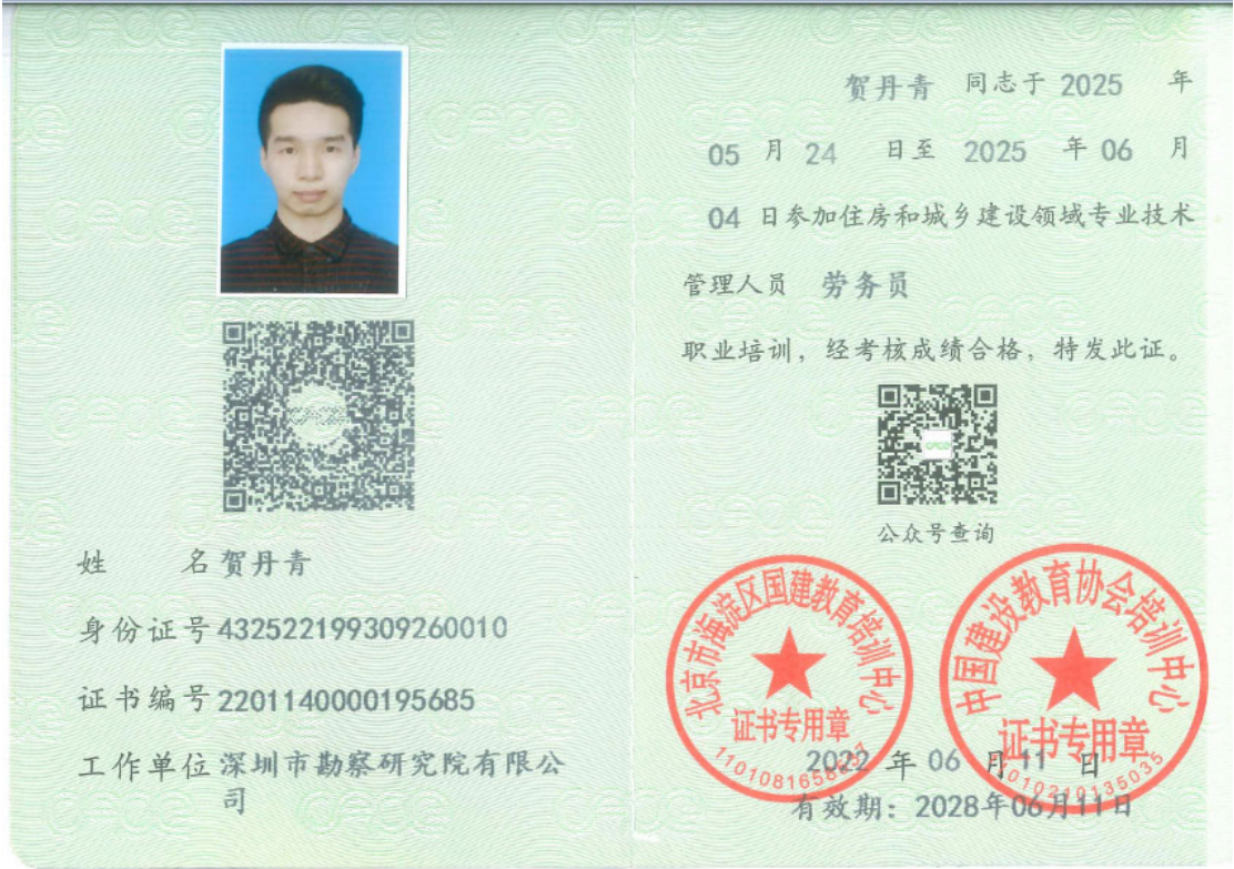
4. 13. 2 劳务员相关证书