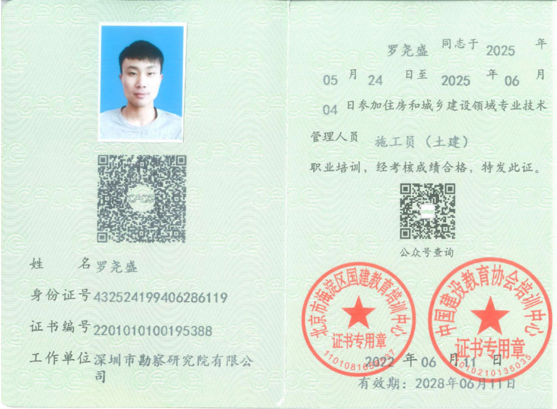
4. 10. 2施工员相关证书