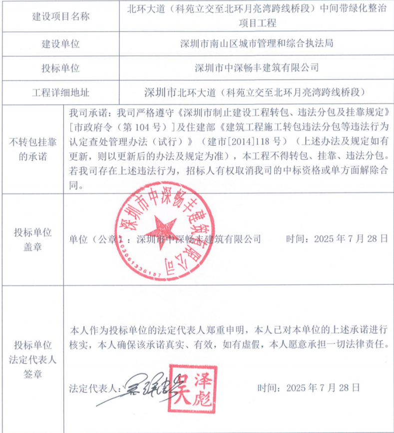
表二、建设工程不转包挂靠承诺书