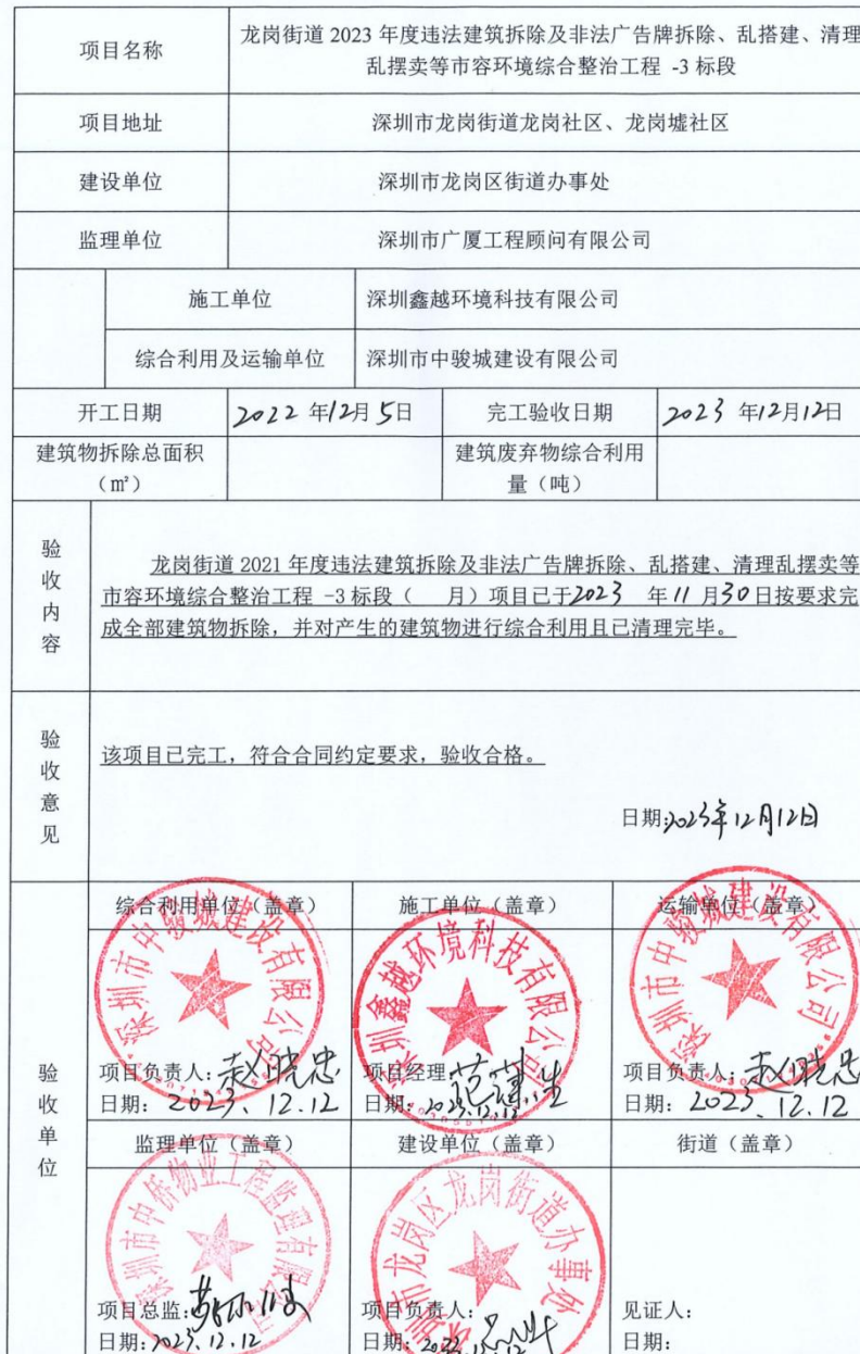
龙岗区建筑物拆除及综合利用项目完工验收表