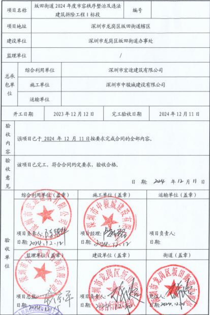
龙岗区建筑物拆除及综合利用项目完工验收表

监理单位 注册号 36001823 有效期至 2025.07.08 监理单位: 中骏城建设有限公司