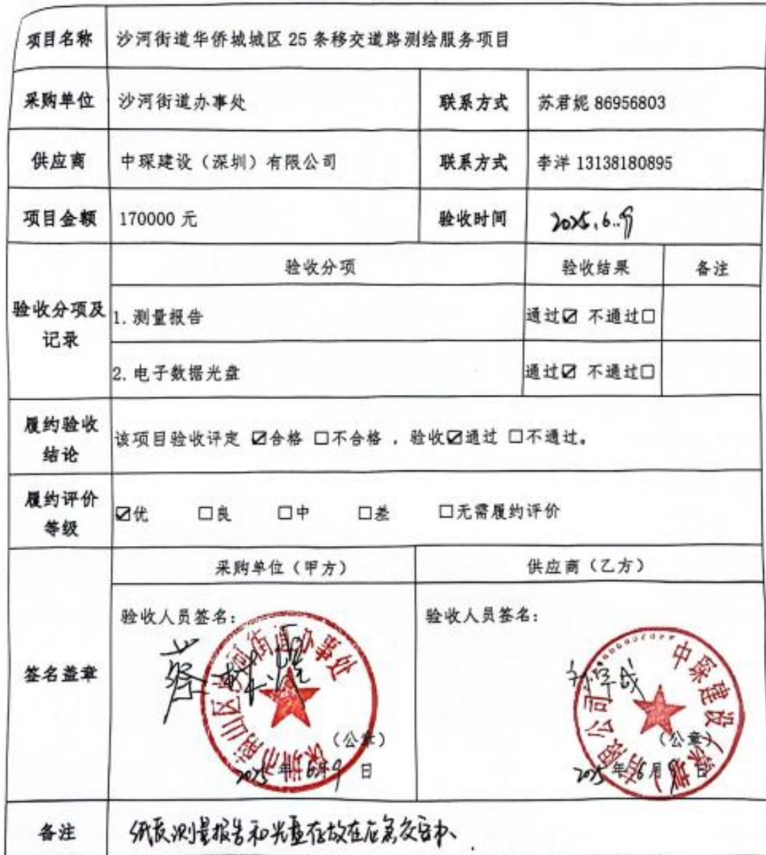
沙河街道采购项目履约验收与评价表

说明：街道 20 万元以上的自行采购项目由业务部门人员和其他部门在编人员组建 3 人以上的验收小组开展履约验收，也可聘请第三方机构进行履约验收；20 万元以下的由业务部门自行验收。