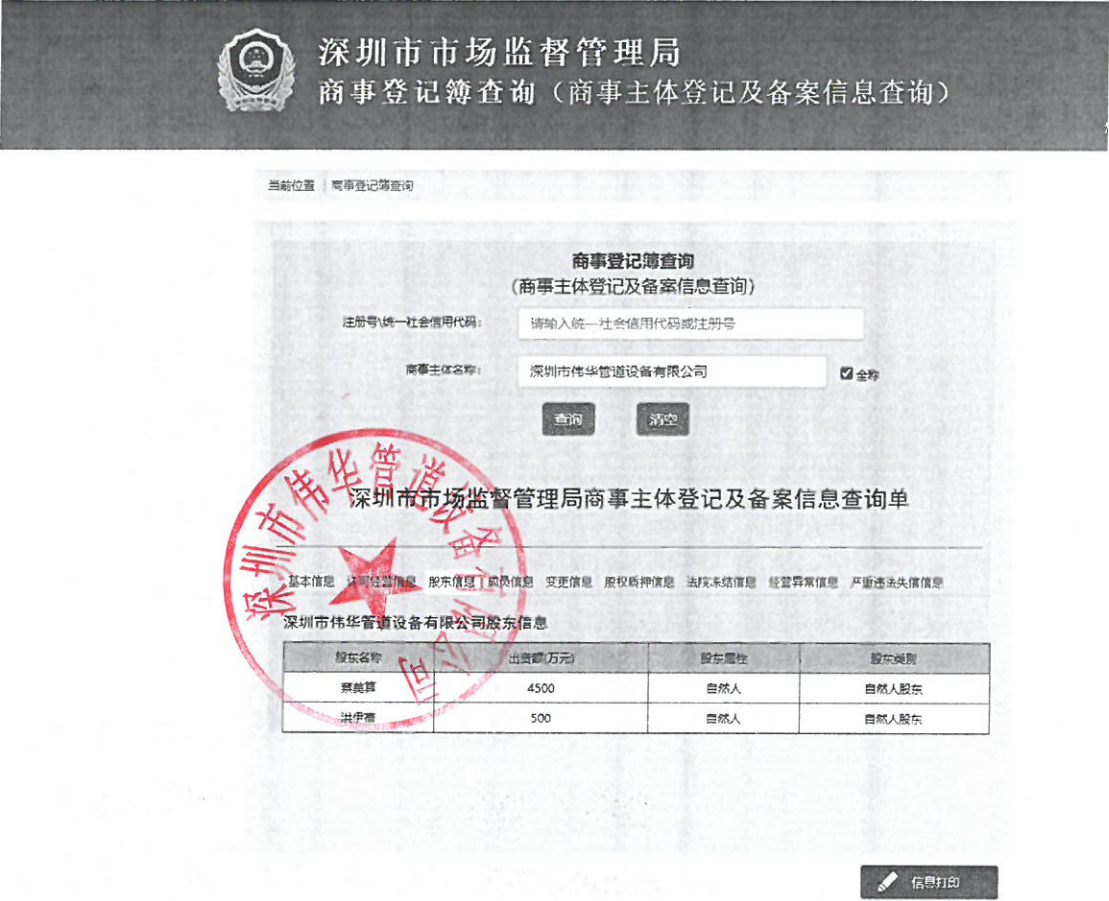
工商部门网站股东控股情况查询截图