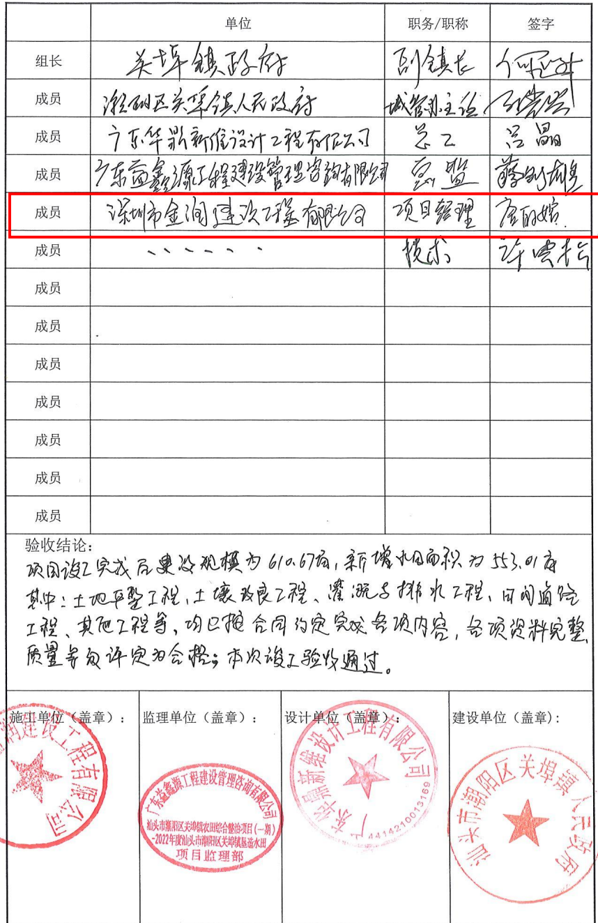
表G.1 竣工验收组成员签字表