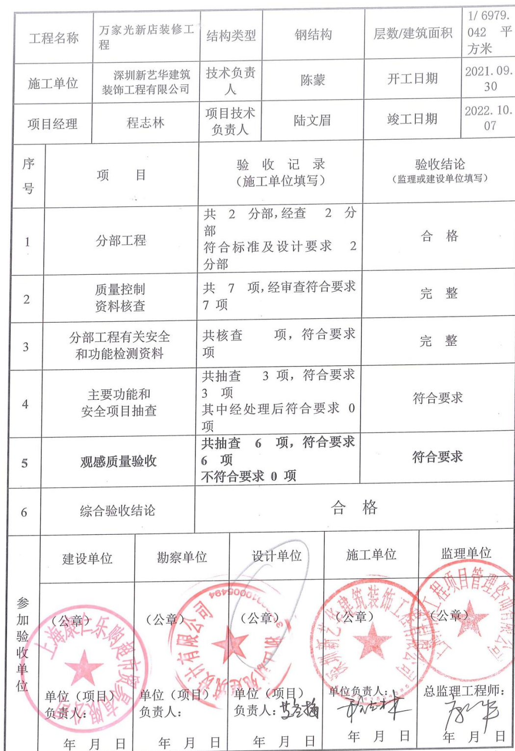
单位(子单位)工程质量竣工验收记录